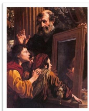
Pier Francesco Mola, Socrate e i giovani, Villa Ciani, Lugano (CH)